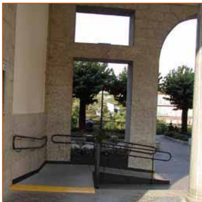
Ultimato e perfettamente agibile da tutti, lo scivolo sotto il portico del Comune.

Riguarda il Nuovo Interscambio di via Forlanini. E' indubbio che il nuovo capolinea dei bus urbani ed interurbani posizionato all'inizio di via Forlanini sia insufficiente rispetto alle reali necessità manifestate. Si è in attesa che la Provincia realizzi in tempi brevi il secondo centro di interscambio presso il polo scolastico di Presezzo, in modo tale di consentire la messa in sicurezza dell'intera zona, nell'ottica di una miglior vivibilità dei cittadini, obiettivo dichiarato e perseguito dalla nostra amministrazione.