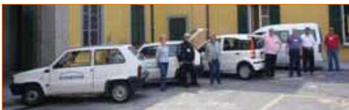
La nuova Eco Panda in forza al Servizio Sociale... sempre più mobili e vicini a chi ha bisogno. Grazie ai volontari dell'ANTEAS ed al prezioso supporto di lavoratori socialmente utili.

- progetti di sollievo e di integrazione socio-occupazionale