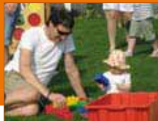
Alcune immagini relative alla festa dello scorso 20 giugno 2008